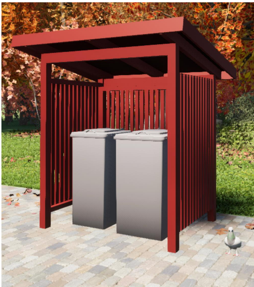
Modell på avfallskärlstaket.

För 240L+240L eller 240L+ 140L avfallskärl