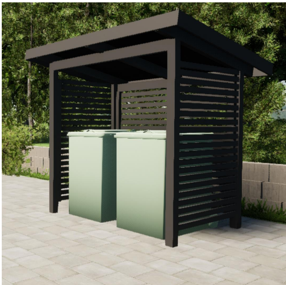
Modell på avfallskärlstaket.

För 240L+240L avfallskärl eller 240L+Quattro Select