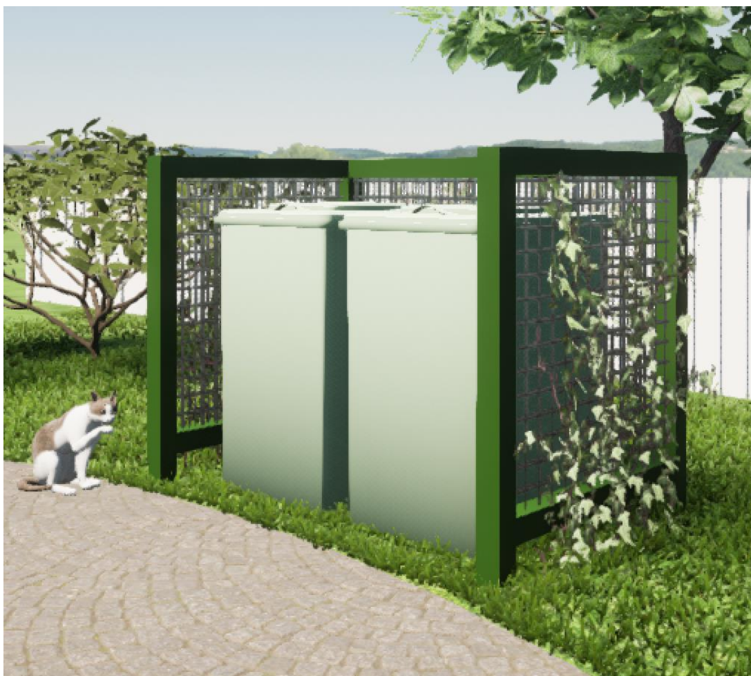
Modell på avfallskärlsskyddet.