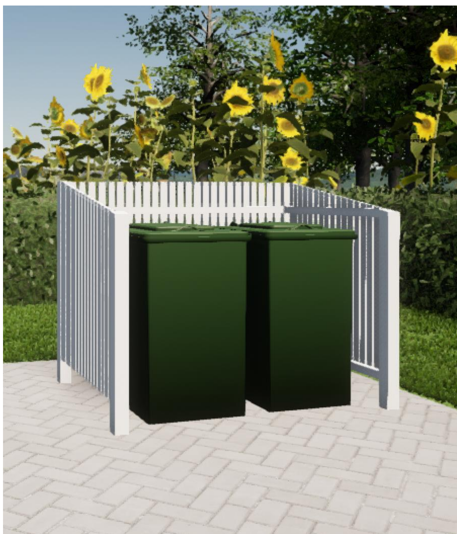
Modell på avfallskärlsskyddet.

För 240L+240L avfallskärl eller 240L+Quattro Select